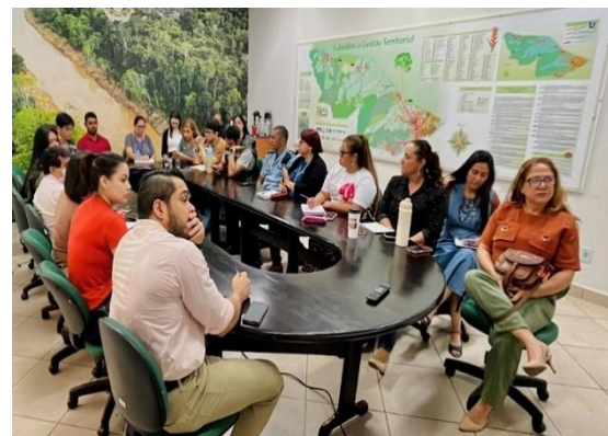
Figura 11. Reunião de Alinhamento das Atividades em Alusão ao dia Mundial da Água.