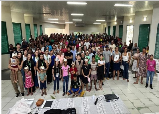
Figura 7. II Seminário de Conscientização da Atividade Pesqueira, em Brasília/AC.