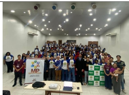
Figura 4. Ação MP nas Comunidades.