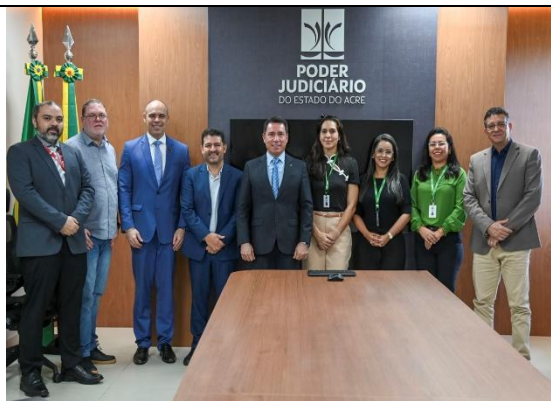
Figura 15. Reunião de apresentação de proposta de projeto para o Tribunal de Justiça do Estado do Acre – TJAC.