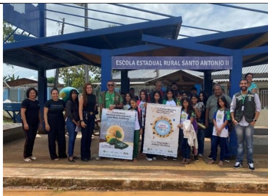
Figura 3. Ação na Escola Estadual Rural Santo Antônio II.