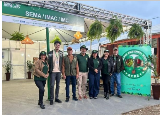
Figura 14. Participação da DEA/IMAC na Expo Juruá, em parceria com a SEMA.