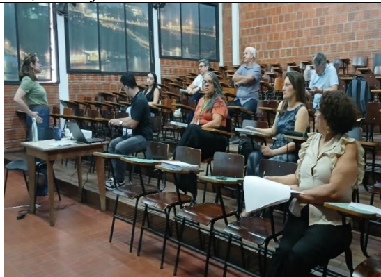
Figura 10. Reunião da COE com a representante da DEA/IMAC e demais órgão do governo.