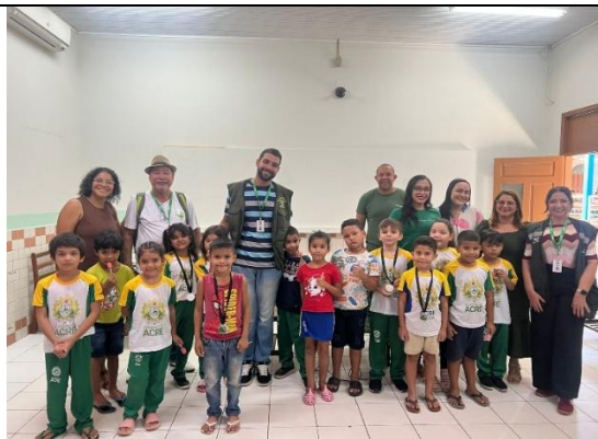
Figura 2. Ação na Escola Clarisse Fecury.