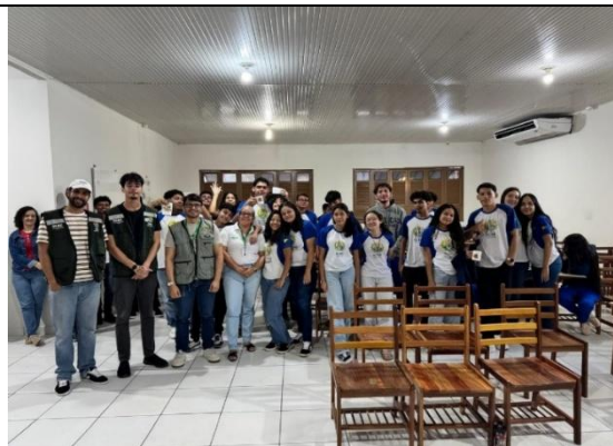
Figura 1. Ação de sensibilização sobre o Dia Mundial da Água.