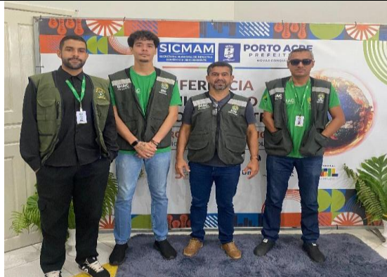
Figura 13. Representantes da DEA 1º Conferência Municipal de Meio Ambiente de Porto Acre.