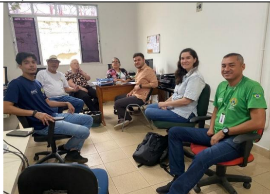
Figura 9. Reunião de Alinhamento e organização da Oficina Monitora EA. DEA e representantes da SEMA e SEE.