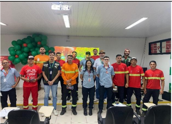
Figura 5. Reunião Extraordinária ABEMA.