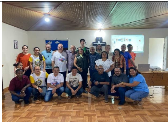
Figura 6. Palestra para diácono e esposas de diácono da Diocese de Rio Branco.