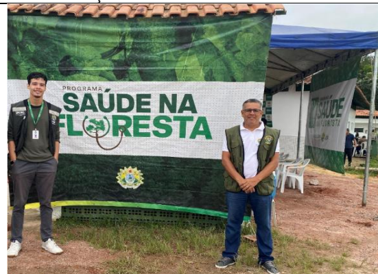
Figura 17. Ação na Escola Estadual Rural Santo Antônio II.