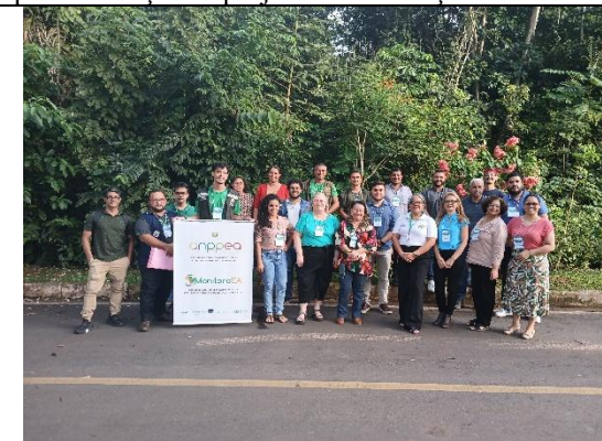
Figura 18. Oficina MonitoriaEA AC.