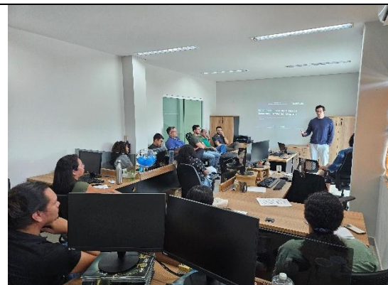
Figura 16. Reunião com técnicos do IMAC para apresentação de propostas de ações e projetos de Educação Ambiental.