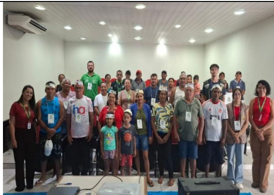
Figura 8. I Seminário de Conscientização da Atividade Pesqueira, em Feijó/AC.